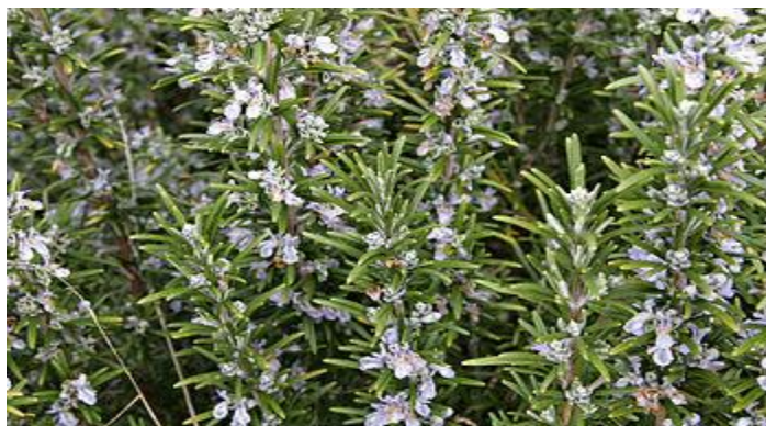
Εικόνα 7. Φυτό Δενδρολίβανου

Πολυετής αειθαλής θάμνος αυτοφυής σε Μαρόκο, Τυνησία, Ν. Γαλλία, κ.α.