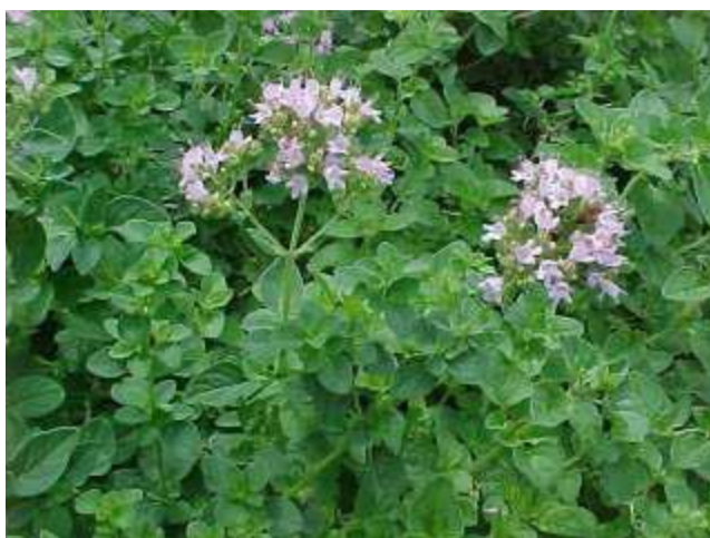
Εικόνα 3. Ρίγανη ( Origanum vulgare ).

Σε επίπεδο ΕΕ, η Ελλάδα και η Γερμανία έχουν τις περισσότερες καλλιεργούμενες εκτάσεις ρίγανης (550 και 531 εκτάρια, αντίστοιχα). Οι κυριότερες χώρες προορισμού των ελληνικών εξαγωγών είναι οι ΗΠΑ και η Γερμανία, ενώ οι εισαγωγές προέρχονται από την Τουρκία, τη Βουλγαρία και την Αλβανία ( www.agrool.gr ).