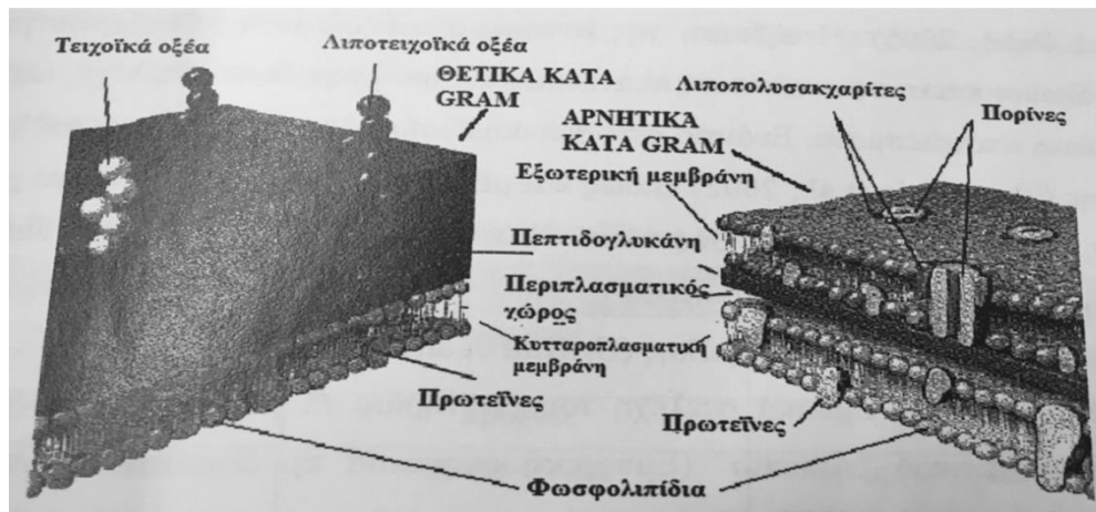
Εικόνα 2. Το κυτταρικό τοίχωμα των θετικών και αρνητικών κατά Gram βακτηρίων ( http://filebox.vt.edu/users/chagedor/biol_4684/Methods/cellwalls.html )

Η εξωτερική μεμβράνη του κυτταρικού τοιχώματος των αρνητικών κατά Gram βακτηρίων εμφανίζει υδρόφιλο χαρακτήρα, με αποτέλεσμα να παρεμποδίζεται η εισχώρηση υδρόφοβων ενώσεων (π.χ. αιθέρια έλαια) στο εσωτερικό του κυττάρου (Vaara 1992, Rota et al 2004). Ωστόσο, η επιφάνεια της εξωτερικής μεμβράνης του κυτταρικού τοιχώματος των αρνητικών κατά Gram βακτηρίων φέρει επίσης πρωτεΐνες που διατάσσονται σε τριάδες και σχηματίζουν πόρους (πορίνες, Εικόνα 2 ). Οι πόροι αυτοί λειτουργούν ως κανάλια μεταφοράς (transport channels), τα οποία είναι αρκετά μεγάλα, μέσω των οποίων μπορεί να διέλθουν διάφορα μόρια όπως οι υποκατεστημένες φαινολικές ενώσεις των αιθέριων ελαίων. Οι εισερχόμενες μέσω των πορινών φαινολικές ενώσεις διαπερνούν στη συνέχεια τον περιπλασματικό χώρο και μπορούν να καταλήξουν τελικά στην κυτταροπλασματική μεμβράνη του κυττάρου (Holley and Patel 2005, Lambert et al 2001)