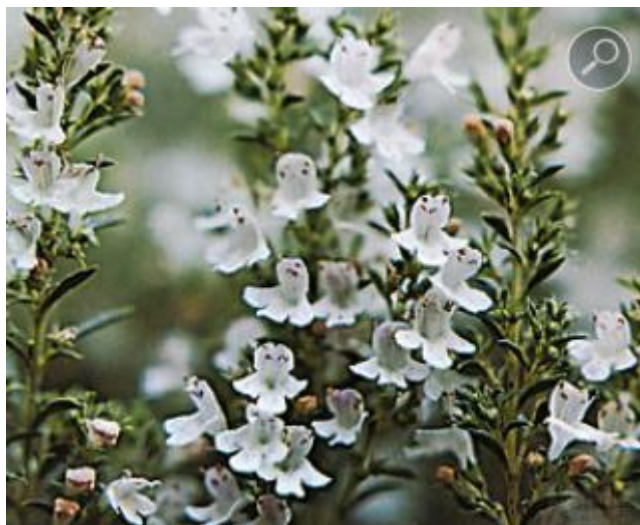
Εικόνα 4. Θυμάρι ( thymus sibthorpii ).

μεγαλύτερη συχνότητα στις τιμές 1,5-2% χωρίς αυτό να σημαίνει ότι σε κάποια πειράματα δεν έχει δώσει μεγαλύτερες αποδόσεις (4%).