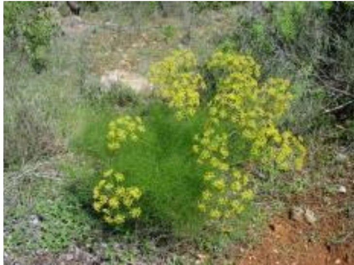
Εικόνα 6. Μάραθος ( Foeniculum vulgare ).