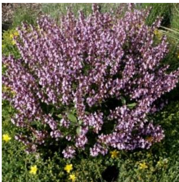
Εικόνα 5. Φασκόμηλο ( Salvia officinalis ).

Τα φύλλα του είναι επιμήκη και παχιά χρώματος λευκοπράσινου. Τα άνθη του φύονται κατά σπονδύλους, είναι χρώματος ιώδους και ανθίζουν από το Μάιο ως τον Ιούνιο, περίοδο κατά την οποία συλλέγεται. Όλα τα είδη του φασκόμηλου πολλαπλασιάζονται με σπέρματα, παραφυάδες ή μοσχεύματα.